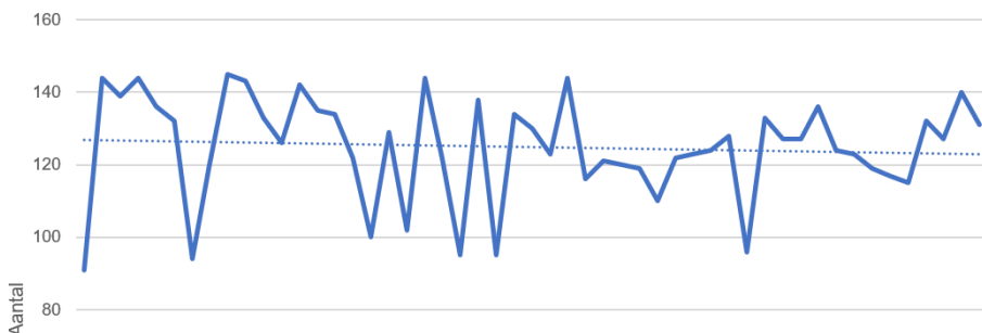
Aantal maaltijden per week